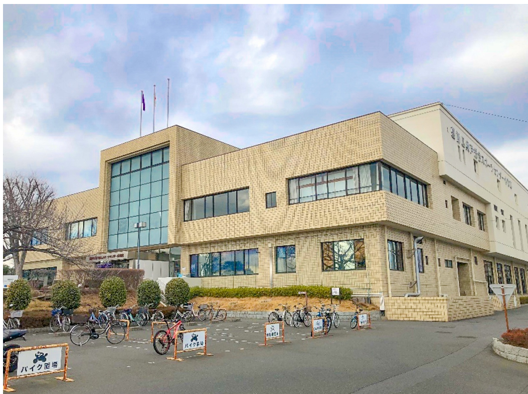
葛飾区奥戸総合スポーツセンター